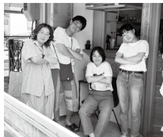
一両編成のメンバー写真(友人4人で活動しています)

高齢者の方々との接点を、さまざまな形で作っていきたく思いますので、ケアマネジャーの皆様には、人