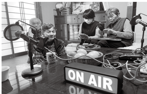
おばあさんラジオ取材風景

アリングさせて頂きました。この事業を理解して下さる人を増やすために資料作りをしています。そこでは高齢者特化型