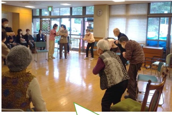
運動、口腔、栄養のプログラム