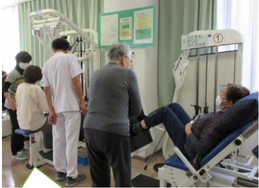
利用者の目標達成を目指し、個別プログラムの取組。終了後は、自宅用プログラムも提示