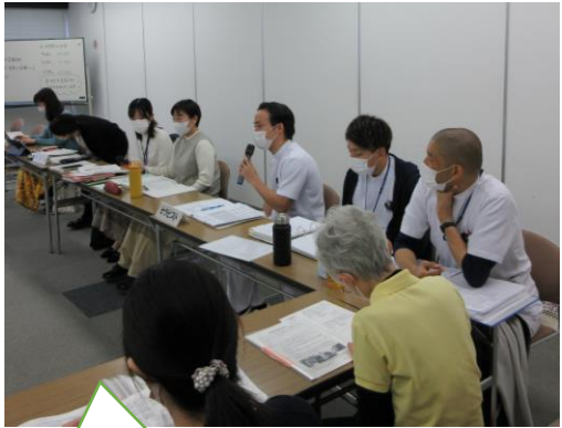
関係者でのケア会議