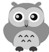
カフェマスターのかたろうくん

ては本人の物を勝手に破棄することは出来ない。退院後、在宅医の先生がまた服用指示を出されるかもしれない。等の理由があり、結論は出なかったそうです。この時に当たり前と思っていたことも話を聞いてみるとそれぞれの事情や考えがあるということに気がつき、知ったからこそその理解と今後の連携につながる感じたとのことでした。