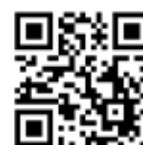
株式会社Canvasの ホームページ QRコード