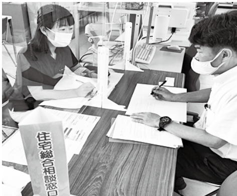
空き家のことで困られたら一度相談してみてもいいかもしれません。

ケアマネジャーの皆様は、一人暮らしの高齢者の方、または子供が遠くで暮らしていて、今は高齢者のみで暮らしている方と接する機会が多いかと思えます。「今住んでいる家を将来どうしたら良いか分からない。」などのご相談をお受けになった時は、まずは空家対策係をご紹介ください。内容によっては対応できない場合があるかもしれませんが、空き家についての悩みをお持ちの方々に対し、少しでもお力になればと思います。どうぞよろしくお願ひします。