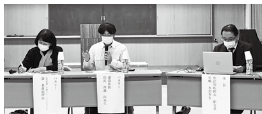
「パネルディスカッション」在宅医、在宅ケアマネ施設ケアマネ、訪問看護師の各立場から情報提供

これらは、毎月の定例会を継続し情報を共有してきたことで、どこかのステーションが孤立することなく、困ったときに気軽に相談できる体制が作れていたから、ステーション同士のスムーズな連携に繋がったのだと思います。今回の新型コロナウイルス感染症への対応を行ったことで多くのことを学び、良い経験ができました。これからも横の連携を大切にし、もし災害が起こった際にも生かして行きたいと思います。