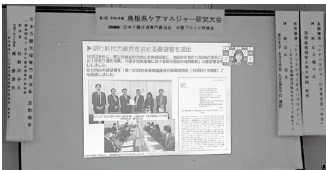
会場とオンラインのハイブリッド開催

「ケアマネジャーの未来を見つめる」をテーマに、様々な角度からの学び、気づきの連続で、開会から閉会迄あっという間の一日でした。介護支援専門員協会の役割や活動の大切さに気付くとともに、ひとりのケアマネジャーとして元気をもらった一日でした。ありがとうございました。