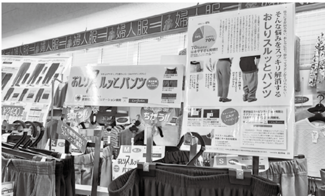
品揃えも豊富です