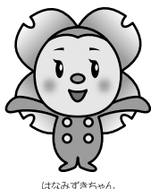
はなみずきちゃん

〒690-0859 島根県松江市国屋町322番地8 TEL 0852-33-7511 FAX 0852-33-7512 ホームページ http://hanamizuki3228.com