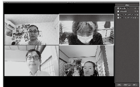
Zoom を使用してのウェブ会議の様子

今年度中はコロナ対策としてのテレワークを認めるという松江市の方針が決まっていますが、ピー・ター・パンとしては障がい者の新しい働き方として、テレワークが根付くことを願っています。