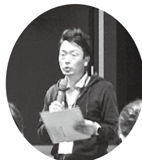
『チームまつえ！ ONE TEAM!!』

グループワークでは、それらの情報を踏まえて行った模擬事例を使って入退院連携の動きについてそれぞれの立場から意見を出し合い、理解を深めました。